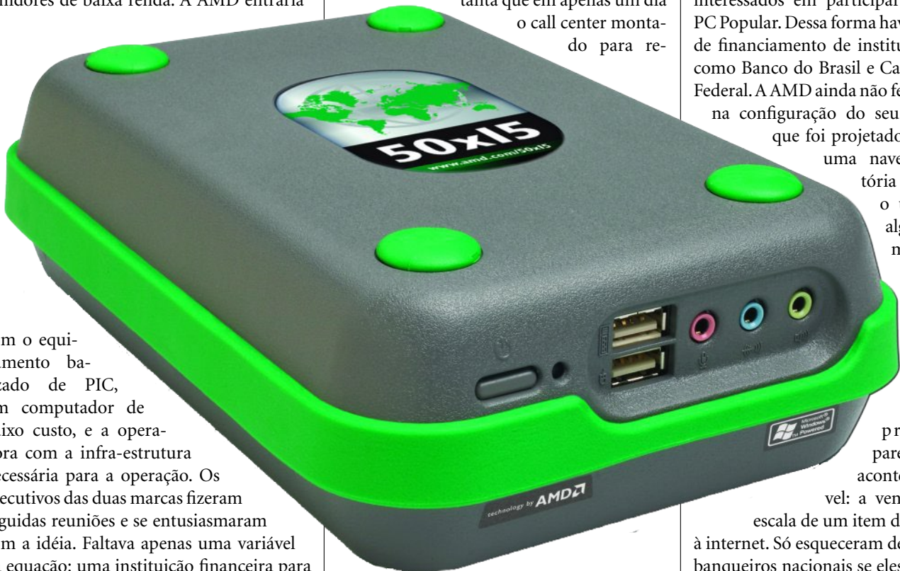
PIC da AMD: A intenção era vender cada máquina por cerca de R$ 800 que poderiam ser pagos em 36 parcelas com juros mensais de 2,6%

escala de um item de acesso barato à internet. Só esqueceram de perguntar aos banqueiros nacionais se eles queriam aceitar um modelo onde o risco seria alto e as taxas de juro abaixo dos percentuais aos quais estão acostumados.